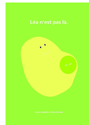
Un livre pour enfants

Pour les parents : Sur un feuillet triptyque, les principaux éléments concernant l'interruption Médicale de Grossesse et le deuil périnatal.