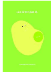
Livres pour enfants

Pour les parents : Sur un feuillet triptyque, les principaux éléments concernant l'interruption Médicale de Grossesse et le deuil