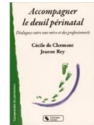
Un livre pour parents et professionnels