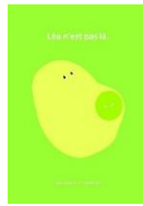
Livres pour enfants